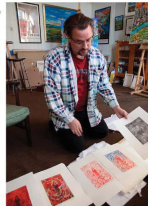
"Walking Through Snakes." Dette bildet har flere ulike og varierte uttrykk på platen. Når du håndklører etterpå, kan du signere med KT (kunstners trykk) eller EA (preuve d'artiste). Hvilket betyr at det bare er ett av det.