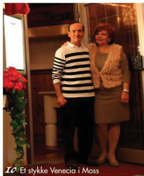
10 Et stykke Venecia i Moss