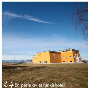
24 En perle av et funkishotell