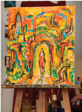
Uttrykket akvatint ligner gouachene. Man maler liksom rett på platen med en blanding av flere ingredienser, bla arabisk gummi. Det fester seg på platen med en gang. Her er det ikke rom for feil, det som fester seg sitter. Man kan også håndklare etterpå.